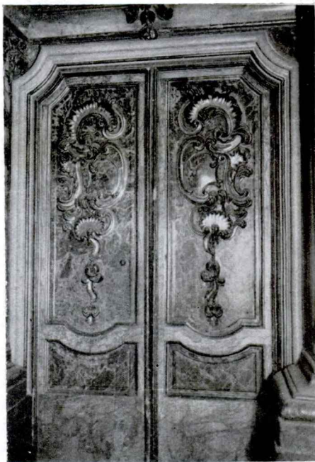
LAM. II — Basílica de Santa Maria de Mataró. — a) Detall del nínxol de les relíquies de les Santes, al retaule major. — b) Detall del nínxol principal amb els àngels del costat de la Candelera. — c) Detall de la balustrada del retaule major. — d) Una de les portes laterals sota les tribunes del retaule major.