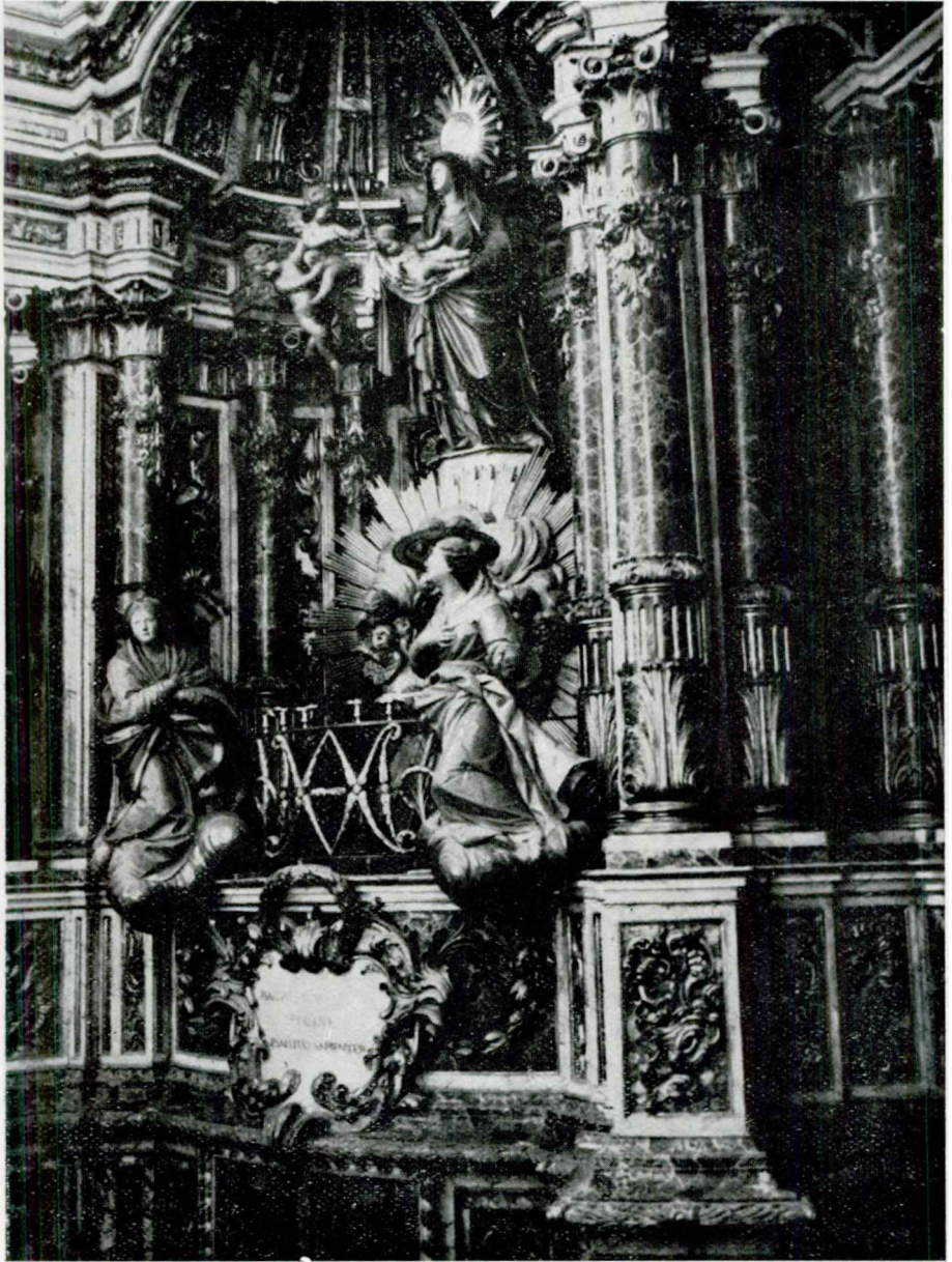
LÀM. I. — Basílica de Santa Maria de Mataró. Nínxol principal del retaule, obra de l'escultor Salvador Gurri.